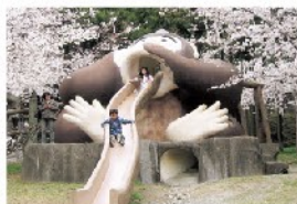
アドベンチャー広場